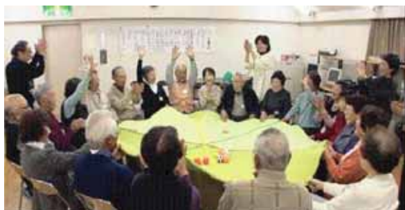
フォーラムではコミュニケーションツールにもなるゲームの体験や意見交流の時間も設けています。

これを契機に首都圏を中心にした、やわらかなネットワークを育てていきたいと思えます。ご興味のある方はぜひご参加ください。