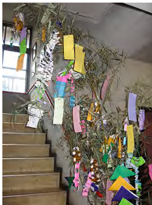
1階エレベーター横に飾りました。