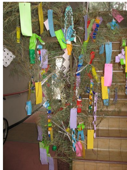
玄関と1階エレベーター横に飾りました。