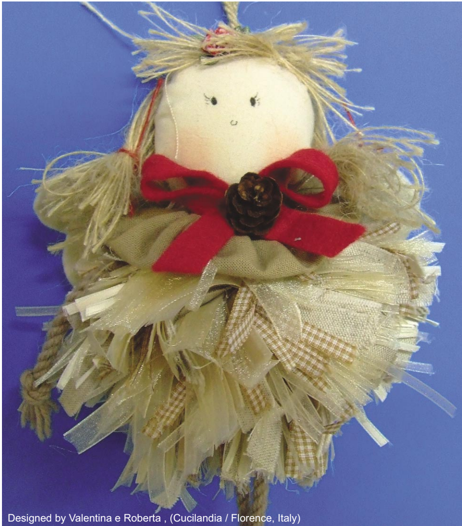
Designed by Valentina e Roberta , (Cucilandia / Florence, Italy)