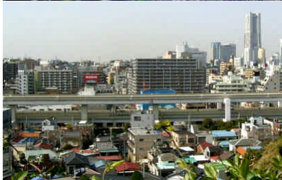
緑の谷戸を脱出して喧騒の横浜都心へ

たちも巣立った。街づくり活動する多くの人たちと知り合い、鎌倉市のまちづくり審議会や深沢計画委員会の委員などもやったから、不在期も多かったが、それなりに鎌倉市民だった。