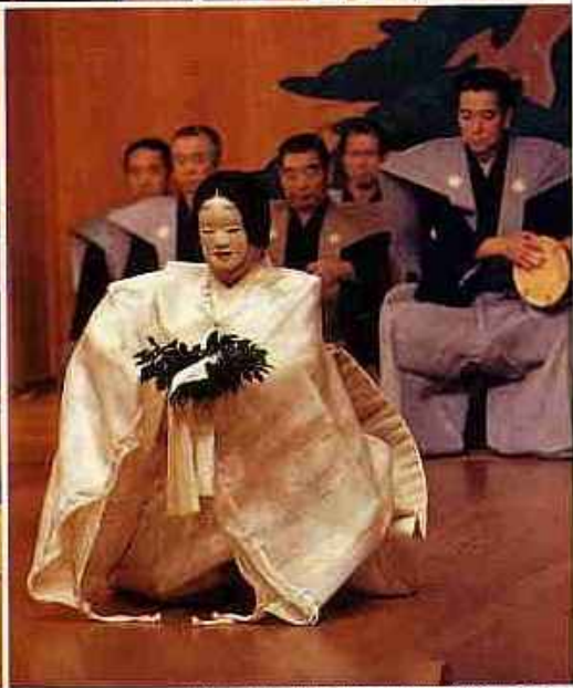
観世能楽堂(成谷)で公演された野村四郎の姿、由名「三輪」。