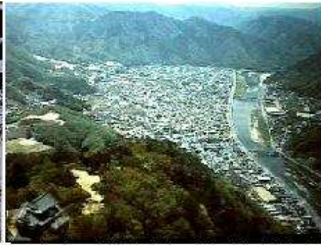
1948年頃の高粱の旧城下町市街(南より) 1990年代の高梁旧城下町市街(北より)