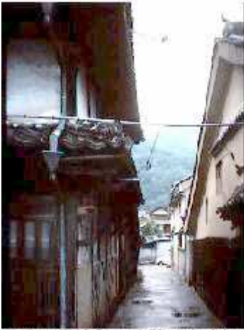
戦中の墨塗壁の痕跡（左上）

う形を見せませぬ。ときたま、戦闘機の編隊が盆地の上空をかすめて、山の向こうに消えていきました。それでも飛行機から目立たないように、白壁土蔵に墨を塗った家もありました。いままその墨が残っている民家もありますが、次第に消えて行きます。その保存を考えなければならぬでしょう。