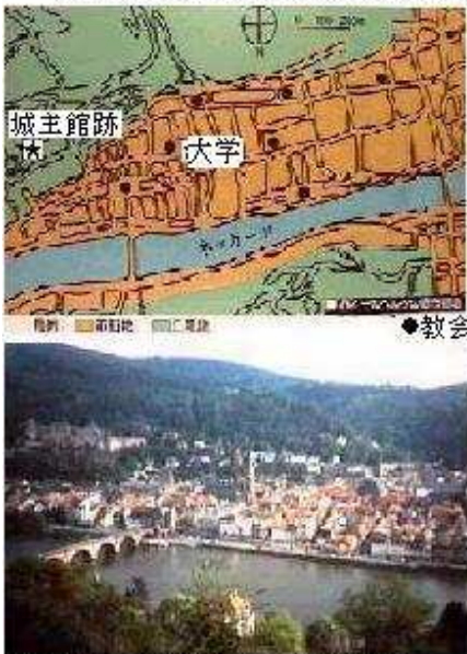
ハイデルベルクのオールドタウン (ネッカー川対岸より)