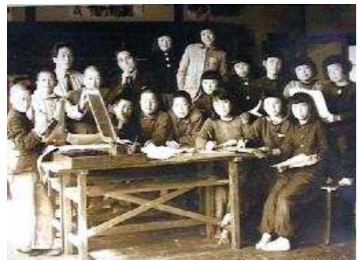
まだまだ貧しい戦後の少年少女たち (1951.3. 高粱北小学校為永学級にて 左から4人目が私)

空腹の記憶は、どうも恥ずかしいようなことばかりです。台所で飯釜に手を入れて盗み食いして叱られたこと、母の里の祭のこ馳走を腹一杯食べすぎてひっくり返って笑われたこと、弟のおやつをとりあげて叱られたこと、パン屋が美に横柄だったこと、チウイングガムを拾って食べたことなど、今思えばつまらないこ