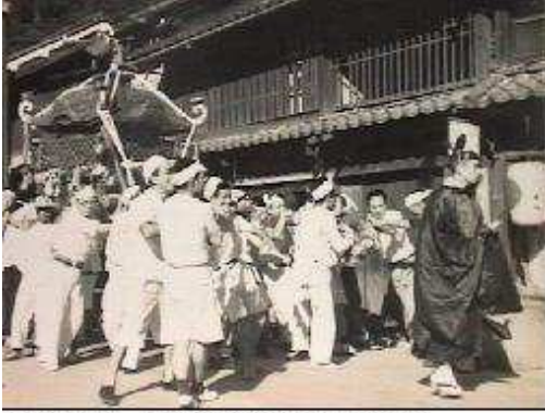
祭礼の日、神輿の前を行く若き父

その逆に、戦争中に親戚に縁故疎開でやってきて机をならべていた子どもは都会に帰って