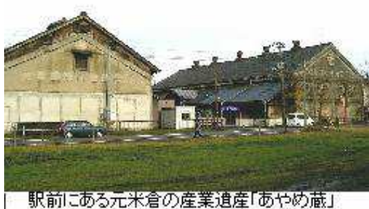
駅前にある元米倉の産業遺産「あやめ蔵」

県と市の間でいろいろ水面下の動きもあった。よつだが、2001年8月、県は病院移転の住民説明会を初めて開催。移転先は駅前が最有力と発表し、ここによつやく事実上の決定を見たのであった。