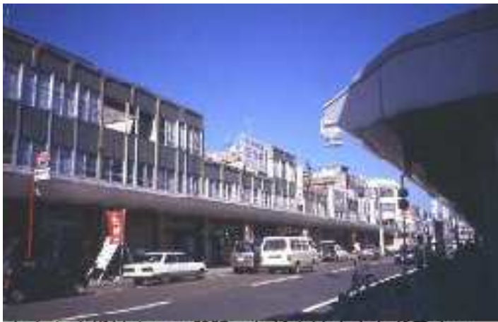
中心商店街はかつて賑しかったが今は空き家が目立つ

いばかりか、これから減る方向の時代だ。よほどの確に土地利用をしないと、隙間だらけの街になるおそれがある。