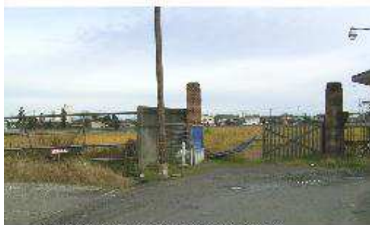
駅前にある旧大倉製糸工場跡地

1999年10月、新発田市商店街連合会は顧客に呼びかけて、駅前の工場跡地に建つ産業遺産建物「あやめ蔵」でまちづくり研究ワークショップを開いた。約80人の市民が、中心市街地をどうするかテーマを囲んで夜遅くまで語り合った。特に、県立病院は高齢社会でも便利な街なかほしい、移転するならば駅前工場跡地に中心街の話題となった。