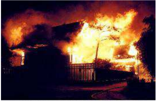
炎上する新発田諏訪神社