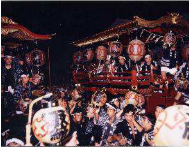
諏訪神社祭礼の帰り台輪