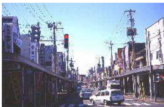
新発田駅前商店街は今、空洞化状態

駅前広場の整備計画であり、これを中心街再生の手立てにしたいが、駅前商店街など関係地権者にとっては先行き不安も大きい。