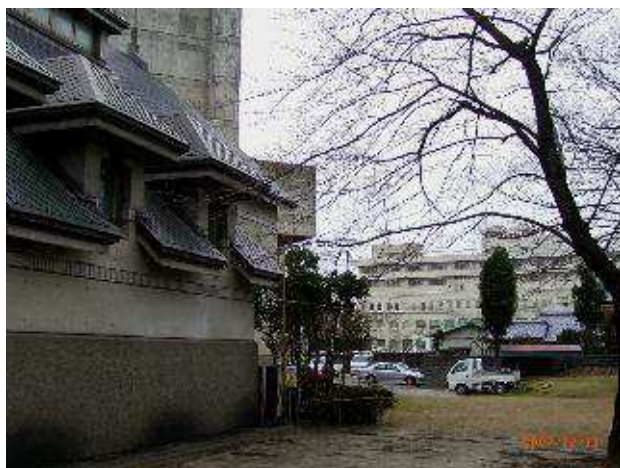
左手前: 蔭谷虹児記念館 右先方: 県立新発田病院

の鉄道利用者にも便利だ。空洞化著しい駅前中心街の活性化にもなる。そこに移転してはどうかという声が高まってきた。