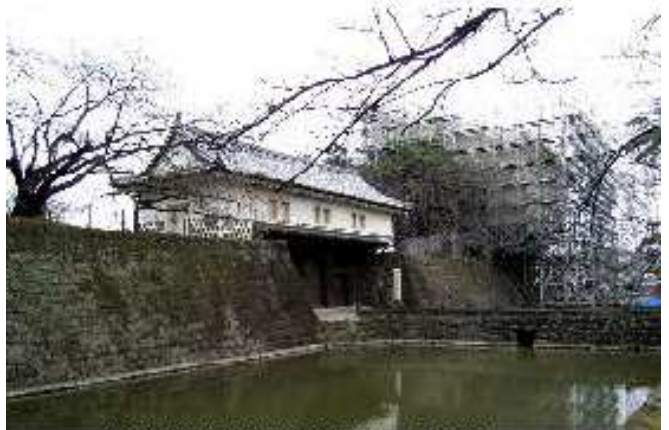
新発田城表門と復元工事中の辰巳櫓 2003.10

柱祭であり、こちらも竣工直後のお祭なので、諏訪大社から旧の御柱を拝受して「ようこ」の企画があります。御柱を市民が街の中を曳き回して諏訪神社に持って来て立てようというのです。災い転じて福となすで、二十世紀新時代のお祭になると思っています。