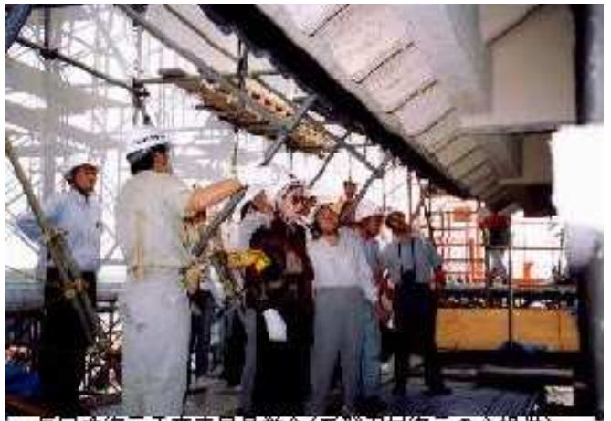
辰巳櫓復元工事市民見学会