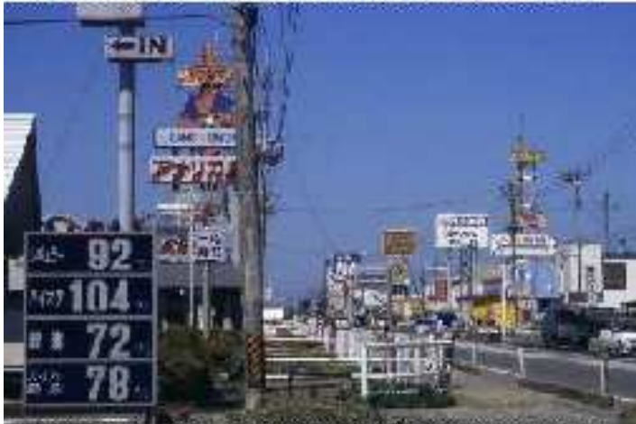
国道バイパス沿いは安売り店群で見えるも無残な風景

中心部の歴史的街並みを守り復原創造するには、景観コントロール策が必要だ。フリンジ地区の醜い風景も何とかしてほしい。