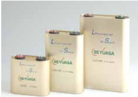
図5 - 人工衛星用大型リチウムイオン電池

リチウムイオン電池は、それに加えて、長寿命、高信頼性、高率充放電が可能等という優れた特長が認められて、その大型リチウムイオン電池が深海用や宇宙用の特殊用に実用化され始めている(図5)。