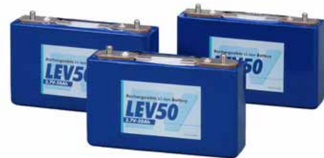
図7 - 電気自動車用大型リチウムイオン電池

例えば、電気自動車は、排ガスを発生しない究極のクリーン自動車として期待され、当社グループとして電気自動車用大型リチウムイオン電池の開発に取り組んでいる。その成果として、(株)リチウムエナジー ジャパン((株)ジーエス・ユアサ コーポレーションと三菱商事(株)、三菱自動車工業(株)の共同設立会社)製の大型リチウムイオン電池が三菱自動車工業(株)の次世代型電気自動車「i MiEV」に搭載されている(図7)。