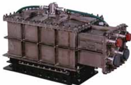
図2 - 「UROV7K」用主蓄電池

まず、深海に設置する係留システムの監視と深海底の調査を目的とする海洋科学技術センターの7,000m級細径ケブル式無人潜水機「UROV7K」(現在は「かいこう 7000 II」のピークル)用のリチウムイオン電池(108V、60Ah)を1997年に納入し(図2) 続いて、海洋科学技術センターの自律航行型の3,500m級無人深海巡航探査機(AUV)「うらしま」用のリチウムイオン電池(126V、300Ah)およびバックアップ電源用のリチウムイオン電池(108V、30Ah)を2000年に納入した。「うらしま」は、そのリチウムイオン電池を主電源として、2002年6月に駿河湾にて132.5kmの連続自動潜水航行に成功した。