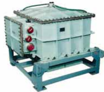
図3 - 「しんかい6500」用主蓄電池

協力による実用化に向けての検討・検証を経て、2004年に海洋研究開発機構に納入した。その後、「しんかい6500」は、2007年3月に通算潜航回数1,000回を達成した。