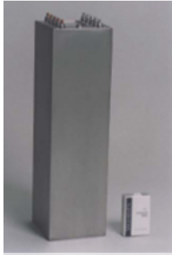
図1 - 深海潜水艇用大型リチウムイオン電池

三菱重工業(株)と(株)ジーエス・ユアサ テクノロジーが開発し納入して運用されてきたものである。その後、同社は、携帯電話用等の製品の開発や量産を通じてつちかってきた最先端のリチウムイオン電池の技術を活かし、酸化銀・亜鉛蓄電池よりも、さらに高エネルギー密度で長寿命の高性能二次電池として、深海探査機用リチウムイオン電池を三菱重工業(株)との共同研究により開発し、納入してきた(図1)。