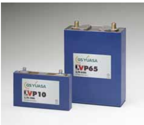
図6 - 航空機用大型リチウムイオン電池

さらに、移動体の高効率化による燃料消費の削減の必要性という点では、航空機も同様の要求があり、機体の軽量化等によって燃料消費効率を大幅に向上する Boeing 社の次世代主力旅客機「787」にも、潜水艇用、宇宙用等の特殊用途で培った高い信頼性および高エネルギー密度等の高い性能が大いに評価され、搭載することが決定している(図6)。