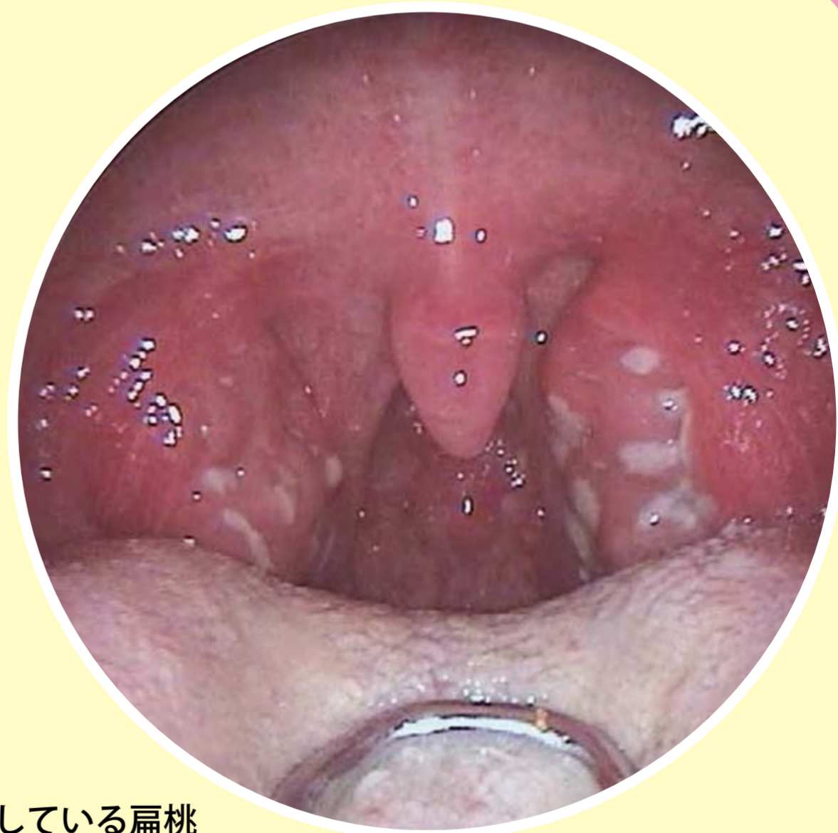
扁桃炎を起こしている扁桃