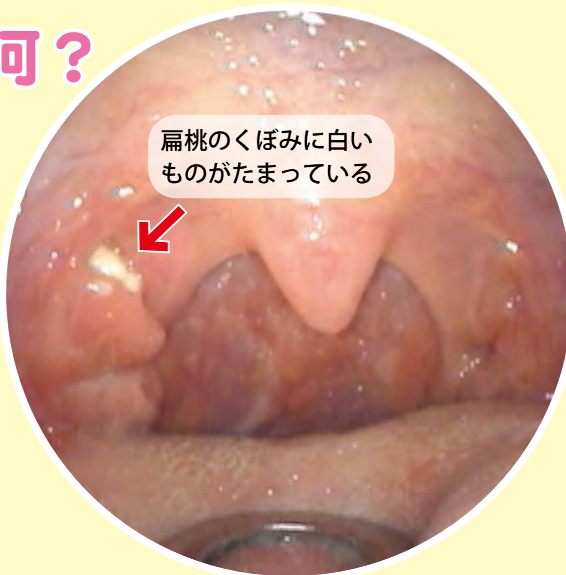
扁桃のくぼみに白いものがたまっている