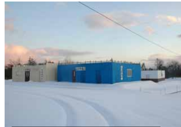
「新たに建設された市街戦訓練施設」(写真上)と「新設された小銃や機関銃の射撃訓練場」(写真右)

ふるさとを侵略のための基地にしないために、平和を愛する県民の総意で、日本原の米軍基地化に反対し、日米共同訓練を中止させましょう。