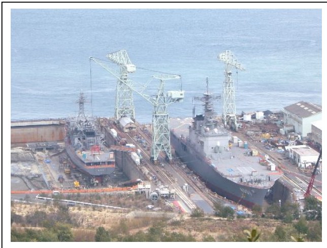
(写真：左が「ちよだ」右が「おおすみ」)

「おおすみ」に收容されている「LCAC (えるきゃっく)」と呼ばれるホバークラフト型運搬船も別途格納庫に收容されているようでした。