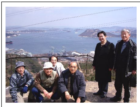
(県平和委員会&玉野平和委員会のメンバー)

天気にも恵まれ、三井造船玉野事業所で建造された輸送艦「おおすみ」・潜水艦救難母艦「ちよだ」がドックに入り、掃海母艦「ぶんご」が接岸し定期改修を行っていました。