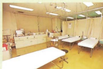
更年期障害の患者にホルモン補充療法など の治療が行われる処置室