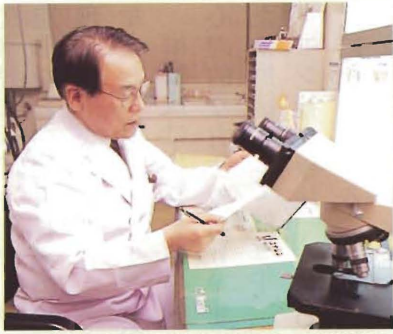
患者の話をしっかり聞くことが、誤診を防ぐ ことにつながるだけでなく、男性更年期障害 の診断を可能にする

アクセス/JR仙台駅から長命ヶ丘、桜ヶ丘団 地行きバスで桜ヶ丘団地入口下車、徒歩3分 http://homepage2.nifty.com/ kimura-c/index.html