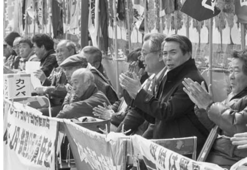
「4者・4団体」の3月国会前中央行動から

② 「アルパ」は闘争団の運動を支える目的で1991年5月に「国労生活事業センター」として発足し、翌年に株式会社として設立されてから、18年にわたって闘争団の生活を支えることはもちろん、運動を全国的に広げる上で大きな役割を果たしてきた。