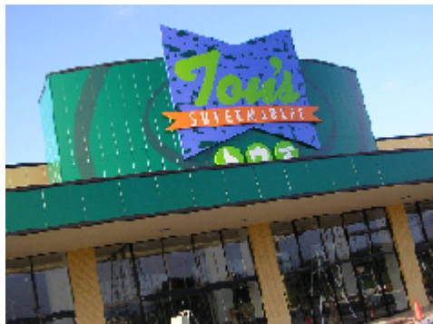
白井店が4店舗目の「トウス」 (写真上)、プロも利用す る「ホームマック」(右)、若い 世代が期待できそうな「プリ スタ」(左下)