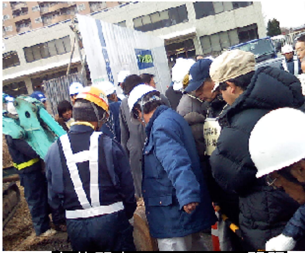
白井駅南口マンション問題

市役所7階の食堂が惜しまれて閉店 市役所7階の食堂が昨年12月27日、営業を終了した。市内の中華レストラン「なかむら」が経営する同食堂は、市職員や市会議員のみならず、市役所を訪れる市民にも広く利用されてきた。