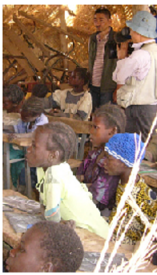
現地小学校での取材班

TBSは3月3日、2時間の特約タ・スペシャル「明日のために」今、ブルキナファソを取り上げる。番組は4部作からなる。