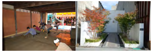
実験住宅「まちの間」

集合場所 : 656広場 / 14時出発 (15時30分エスプラッツにて解散) 参加費 : 無料