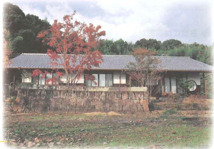
2009 佐賀の家賞 吉村邸 里山に佇む家