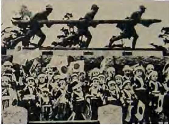
この写真と同じような像が当時の芦屋精道小学校の正門前にあった。 http://www.asahi-net.or.jp/~ku3n-kym/sonota/nikudan/nikudan.html