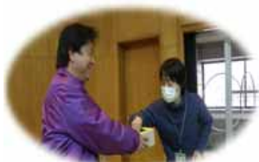
公開抽選会の様子