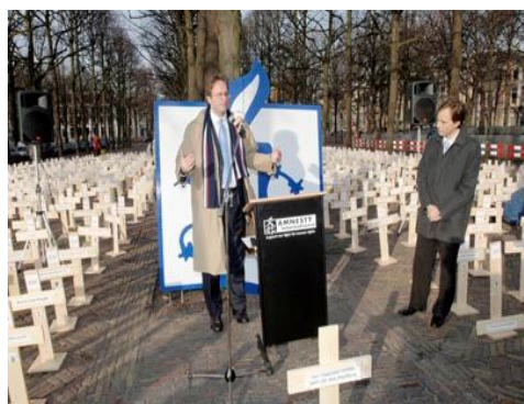
アムネスティ・オランダ、米国で1000人目の死刑執行に際して米国大使館前で抗議