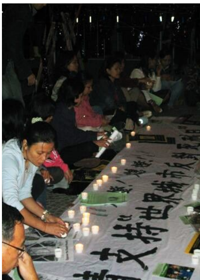
アムネスティ香港、「いのちの都市－死刑に反対する都市」の集会