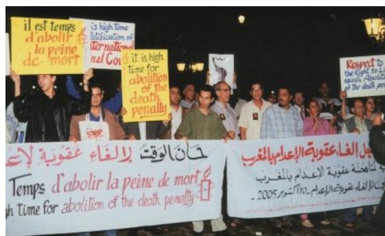
アムネスティ・モロッコ、他の NGO とともに世界死刑廃止デーにデモ行進