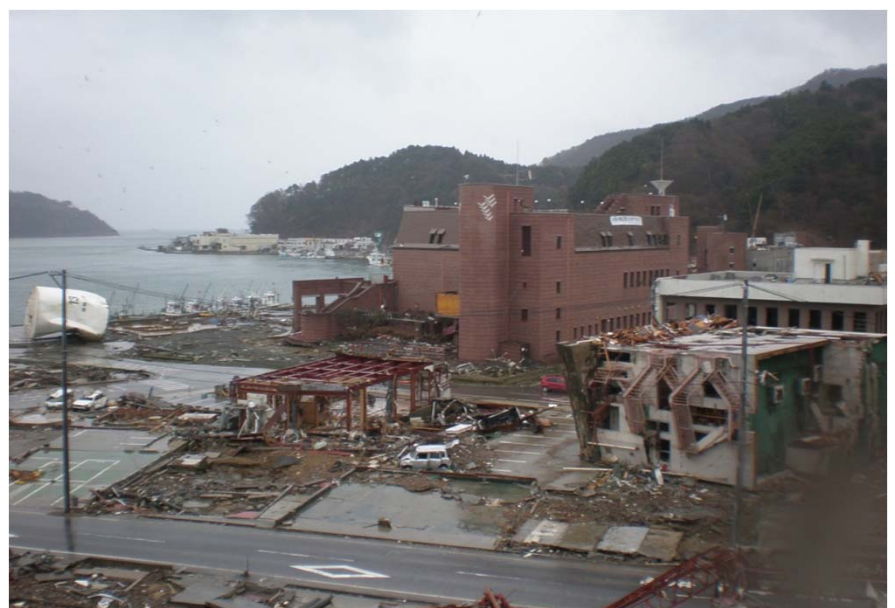
津波で転倒したビル(2011年宮城県女川町)