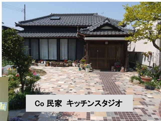
Co 民家 キッチンスタジオ